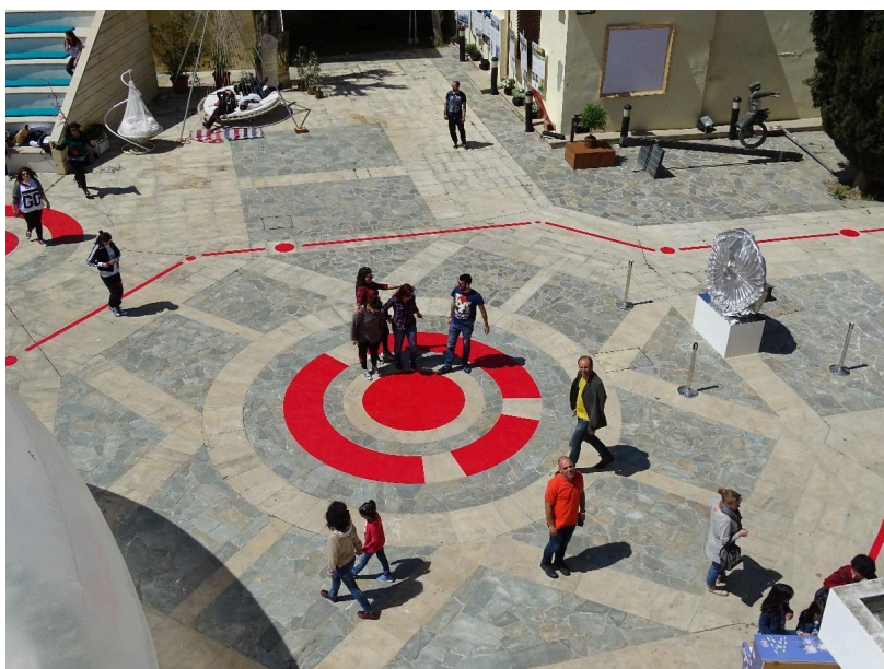
Pathway to the Bubble, Fuskopolis, Πολιτιστικό Ίδρυμα Τράπεζας Κύπρου, Λευκωσία, Κύπρος, 2014