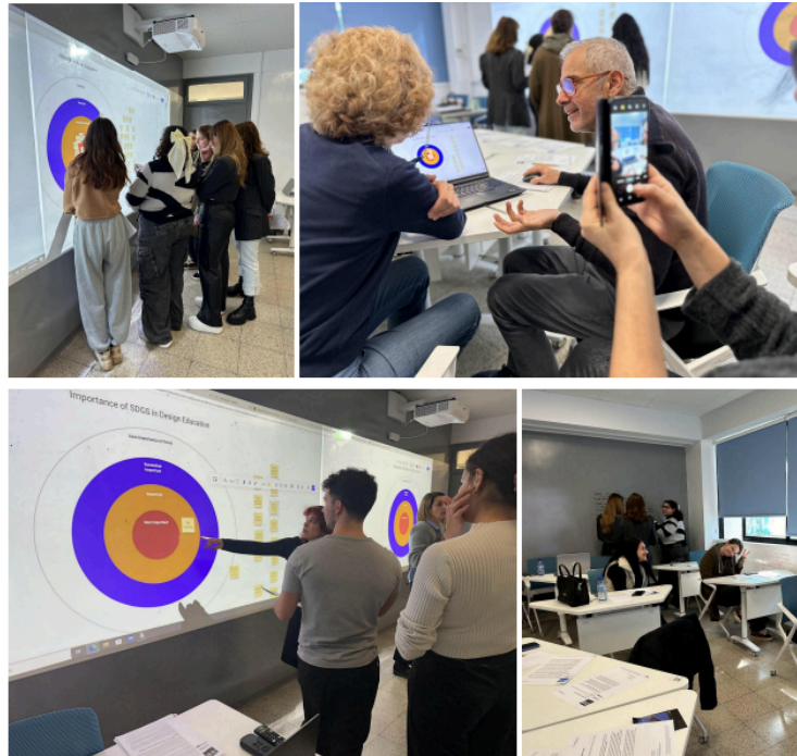
Ομάδες εστίασης και διαδραστικά εργαστήρια (Πανεπιστήμιο Frederick, Κύπρος)